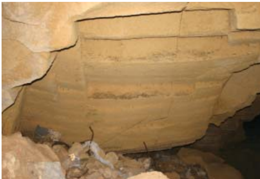
Foto 14 – A circa 50 m dalla zona dove è avvenuto il crollo, in prossimità del nuovo ingresso ricavato per permettere i lavori di consolidamento, una parete evidentemente fratturata evidenzia come il quadro del dissesto sia esteso su una superficie ben più ampia

Comuni che si sono dotati di un Piano Comunale d'Emergenza in materia di Protezione Civile.