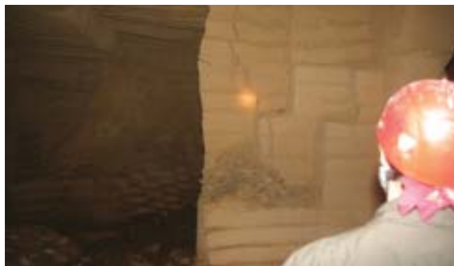
Foto 8 – Schiacciamento, fessure oblique, espulsione di materiale e distacchi interessano una colonna in un ampio ambiente adiacente alla cavità crollata