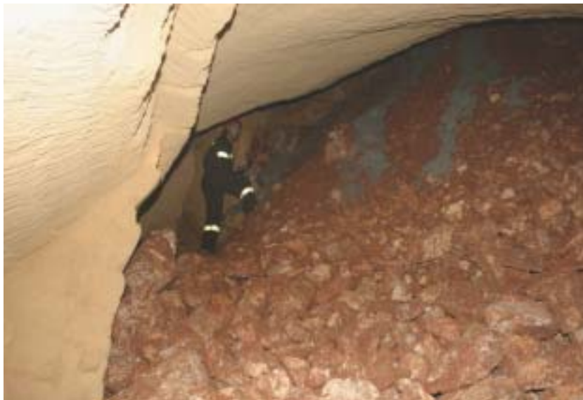
Foto 13 – La voragine è stata ricoperta. Il materiale di riempimento si è disposto secondo il proprio angolo di natural declivio

Sarà perché sotto la voce "a salvaguardia della pubblica incolumità" è più facile disporre di risorse da spendere senza troppi giri rispetto ai tempi lunghi dettati, ordinariamente, dall'acquisizione dei necessari pareri delle varie Commissioni, dalle delibere delle Amministrazioni interessate, dalle opposizioni che si sollevano; ma è facile verificare come nella "gestione dell'emergenza" ad una spiccata solerzia nell'affidamento e nella realizzazione di lavori che rappresentano "opere tampone" si contrapponga una riluttanza a iniziare uno studio approfondito che, coinvolgendo le migliori competenze tecniche nello specifico campo, miri alla realizzazione di un piano di previsione e d'emergenza. E poco importa delle tante leggi fin qui emanate; le linee guida e le indicazioni del Dipartimento di Protezione Civile, della Regione, dell'Autorità di Bacino, di tutti gli altri Enti preposti a vigilare e a prevenire i rischi. Le Amministrazioni che sono tenute ad osservarle hanno sempre altre "priorità" per giustificare l'omissione o il ritardo e purtroppo manca un'autorità di vigilanza sugli adempimenti di Protezione Civile che svolga la necessaria opera di "pungolo" nell'applicazione delle disposizioni anzidette; è sintomatico il fatto che ad oggi, dopo la pubblicazione del D. Lgs. 112/98 (Legge Bassanini), della L.R. della Puglia n° 18/2000, della delibera della Regione Puglia 255/2005, sono pochissimi i