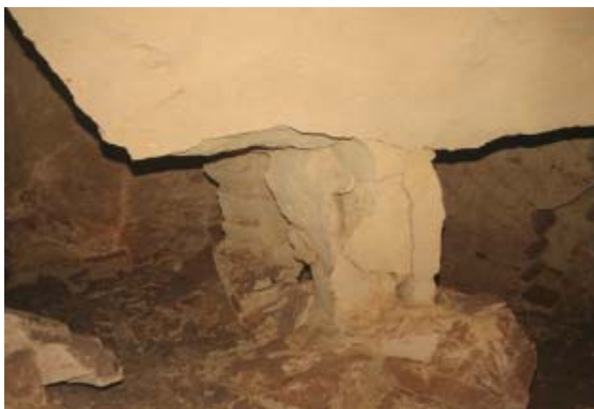
Foto 7 – Cedimenti ed espulsione di materiale caratterizzano buona parte delle strutture di sostegno

appena terminata la riunione. Così, tra lo spargimento di pietrame di varie pezzature e colate di conglomerato "ciclopico", le operazioni di riempimento della voragine sono proseguite speditamente anche di notte (foto 10) fino a quando, alle prime ore del 1° aprile, si è verificato un ulteriore cedimento che ha fatto crollare la corona della volta che aveva resistito ai due eventi precedenti. A questo punto, il dissesto aveva messo a nudo le fondamenta dei due edifici più prossimi facendoli rimanere con i rispettivi angoli a sbalzo sulla voragine ormai semiriempita (foto 11); dalla parte opposta, il "cratere" aveva raggiunto il parco e complessiva-