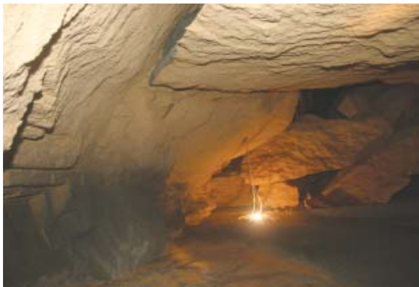
Foto 6 – Un grosso blocco ormai distaccato dall'ammasso roccioso che costituiva la volta ha raggiunto la sua condizione di equilibrio appoggiato su una parete

appena terminata la riunione. Così, tra lo spargimento di pietrame di varie pezzature e colate di conglomerato "ciclopico", le operazioni di riempimento della voragine sono proseguite speditamente anche di notte (foto 10) fino a quando, alle prime ore del 1° aprile, si è verificato un ulteriore cedimento che ha fatto crollare la corona della volta che aveva resistito ai due eventi precedenti. A questo punto, il dissesto aveva messo a nudo le fondamenta dei due edifici più prossimi facendoli rimanere con i rispettivi angoli a sbalzo sulla voragine ormai semiriempita (foto 11); dalla parte opposta, il "cratere" aveva raggiunto il parco e complessiva-