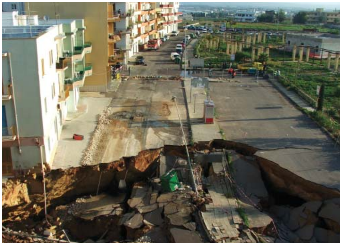
Foto 12 – L'evento del 1° aprile ha comportato il collasso della parte residua della volta che aveva resistito ai crolli precedenti estendendo l'area di danno fino al margine del parco

necessariamente essere preceduti da studi approfonditi, da effettuarsi con la collaborazione tecnico-scientifica dei “centri di competenza” previsti dalla Direttiva del Presidente del Consiglio dei Ministri del 27/2/2004, che portino ad una migliore comprensione del fenomeno e ad individuare le soluzioni più idonee per il ripristino della sicurezza delle cave e degli edifici sovrastanti; nelle more, appare fin troppo evidente la necessità di realizzare una rete automatica di monitoraggio e segnalazione che possa cogliere i segnali precorritori atti ad identificare situazioni di potenziale instabilità che potrebbero mettere a repentaglio la sicurezza dei cittadini, dei soccorritori, delle infrastrutture. Tale indicazione, per altro, trova ragione nel fatto che il nuovo sostegno introdotto – ovvero il riempimento della cavità – ha creato una nuova situazione di equilibrio che si completerà con la redistribuzione delle tensioni interne al materiale; tutto ciò, nel complicato e diversificato quadro fessurativo e di dissesto che interessa l'area più prossima a quella