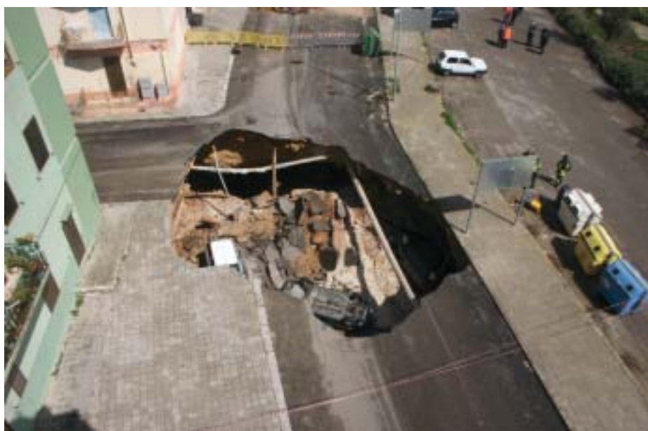
Foto 1 - Stato dei luoghi dopo il primo crollo avvenuto nel pomeriggio del 29/3/2007

Pertanto, con la prudenza che il caso richiedeva, senza creare allarmismi ma nello stesso tempo con fare piuttosto deciso, davamo indicazione affinché venisse completata l'evacuazione delle persone che ancora rimanevano all'interno delle proprie abitazioni ed evidenziavamo la necessità di una esplorazione diretta della cavità per avere un quadro più chiaro del dissesto occorso e della situazione al suo intorno. Ma l'oscurità della sera, alcune parti in imminente pericolo di distacco, un mancato monitoraggio che ci consentisse di valutare con l'attenzione che il