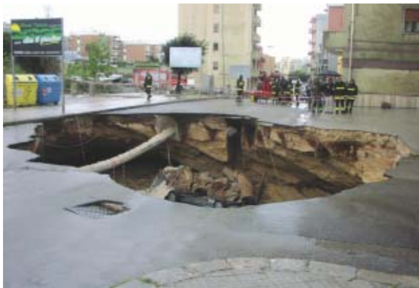
Foto 2 – Evidenza del profondo taglio presente nella volta crollata