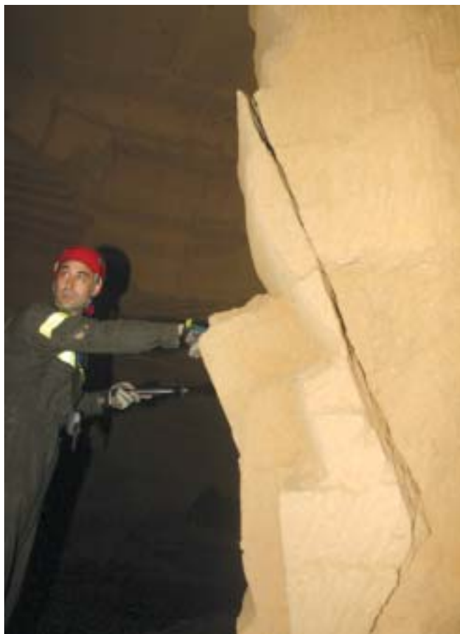
Foto 9 – Particolare del dissesto sulla stessa colonna della foto 8