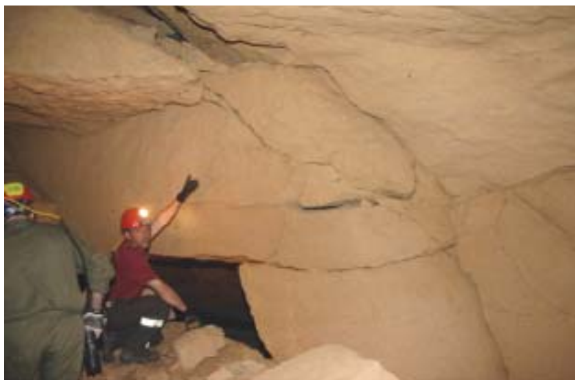
Foto 5 – Un importante e profondo sistema di fratture dei banchi calcarenitici rendeva potenzialmente instabili le strutture più vicine alla voragine

messa in sicurezza dell'area, venivano ribadite le risultanze dell'ispezione e, anche in considerazione dell'indagine visiva effettuata su alcune lesioni individuate sulle murature d'angolo degli edifici posti a ridosso della voragine, veniva evidenziato che lo scenario era ancora in evoluzione a tal punto da ritenere, ciò che era stato osservato, un "dissesto dagli esiti imprevedibili". Ma, a fronte di queste considerazioni e delle testimonianze tecniche prodotte, la decisione presa dal Sindaco ha considerato più di ogni altra cosa la messa in sicurezza degli edifici interessati dal dissesto e a tal fine ha autorizzato i lavori per il riempimento della voragine che hanno avuto immediato inizio