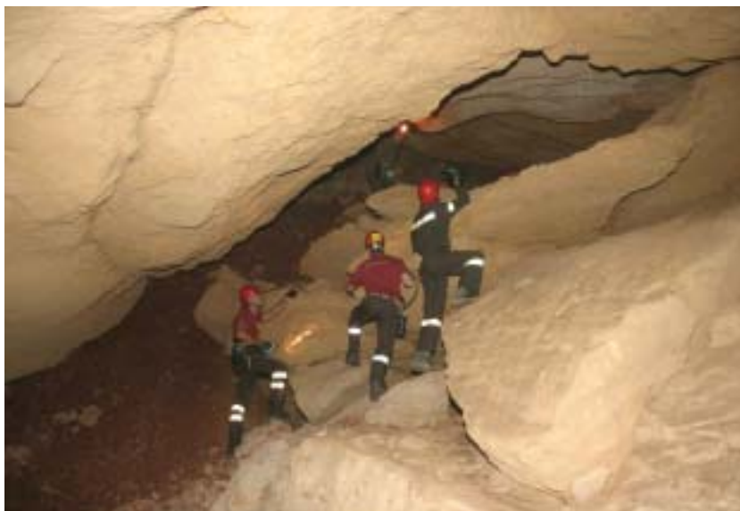
Foto 4 – All'interno delle cavità massi grossi e piccoli evidenziavano ovunque distacchi antichi e recenti dalle volte

edifici direttamente coinvolti dalla voragine, erano interessate da un evidente ed importante dissesto che si manifestava con un diversificato e diffuso sistema di fratture rettilinee a carico dei banchi calcarenitici, orientate secondo varie direzioni ed estese per alcune decine di metri. Una tale situazione ci induceva a ritenere l'area prossima alla voragine come un sistema ancora in evoluzione, con una condizione di marcata instabilità, che lasciava presagire ulteriori imminenti fenomeni di crollo; pertanto, terminata l'esplorazione, si informavano gli organi tecnici del Comune di Gallipoli affinché venisse ordinata l'evacuazione dei nuclei abitativi degli edifici posti nel raggio di 50 m dalla voragine. In effetti, ad avvalorare l'analisi dell'esplorazione effettuata e dei provvedimenti adottati, alle ore 17 dello stesso giorno, si registrava un nuovo crollo che provocava un allargamento della voragine e il distacco di circa 20 mc di materiale; in tale occasione, si registrava un arretramento dell'orlo della voragine nella parte più prossima ai due edifici posti ad angolo e veniva ostruito quello che era stato utilizzato come primo accesso per l'esplorazione di qualche ora prima. A distanza di circa un'ora da quest'ultimo episodio, presso il Comune di Gallipoli si è svolta una riunione a cui hanno partecipato il Sindaco di Gallipoli, l'Assessore ai LL.PP., il Segretario Comunale, i rappresentanti