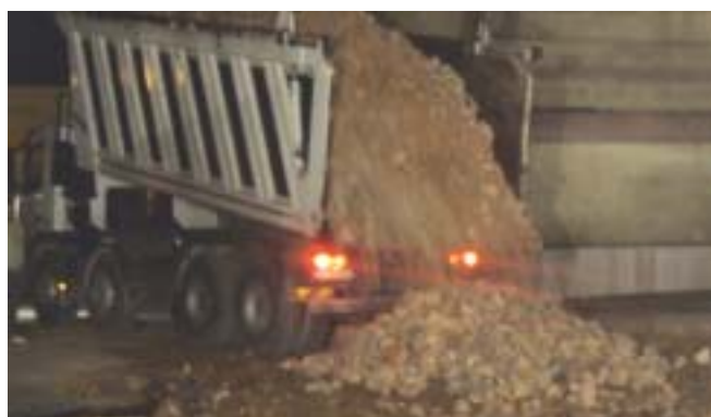
Foto 10 – Le operazioni di spargimento di materiale per il riempimento della voragine