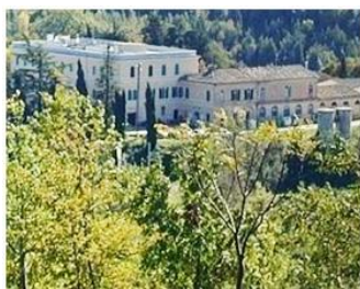
Istituto Agrario Macerata

Contrada Lornano, 6 - 62100 Macerata (MC)