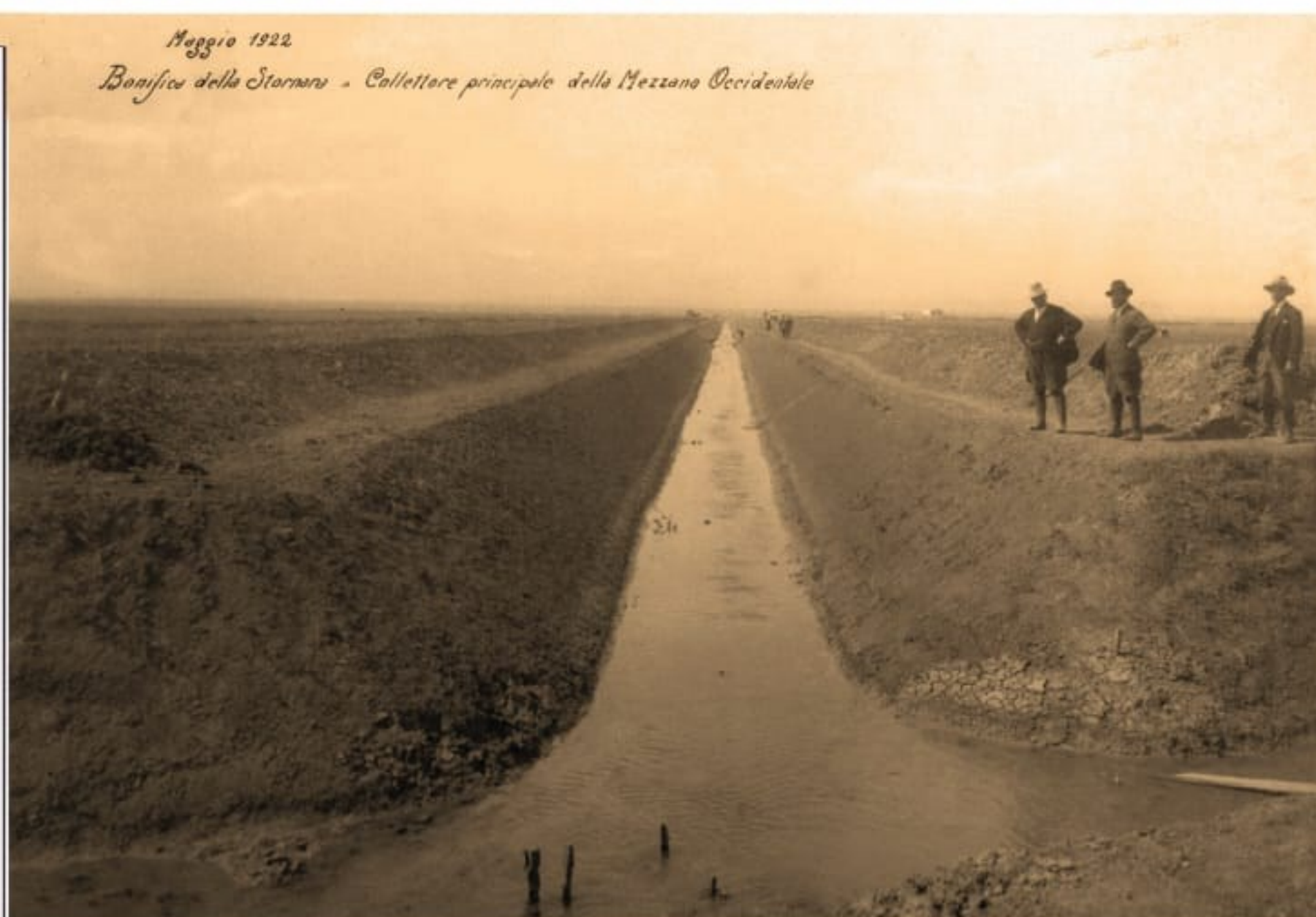
Maggio 1922 Bonifica della Stornara - Collettore principale della Mezzana Occidentale